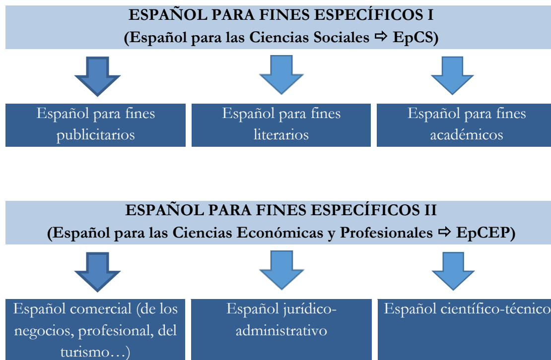
Tabla 2. Clasificación de los fines específicos del español (Adaptado de Mora Sánchez, 2006)

Este tipo de caracterizaciones genéricas, poco definitorias, de las lenguas de especialidad y las agrupaciones en torno a las pautas de variación lingüística llevó a una revisión de los posibles conglomerados resultantes, en el caso del español, de fines específicos en función de la concurrencia de rasgos lingüísticos concomitantes, y que tuvo como resultado la siguiente propuesta de clasificación: